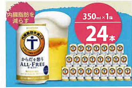
サントリー からだを想うオールフリー 350ml