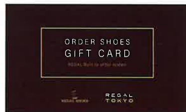
③ REGAL Built to order system 専用ギフトカード(66,000円分)

デザインや素材を選んでカスタマイズできるパターンオーダーシステム「REGAL Built to order system」専用ギフトカード。