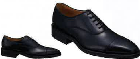
② REGAL 11ALBHT ストレートチップ ブラック(エアローテーションシステム)

上質なドレスシューズにエアローテーション機能を搭載 35mmのハイヒール仕様の高機能シューズ