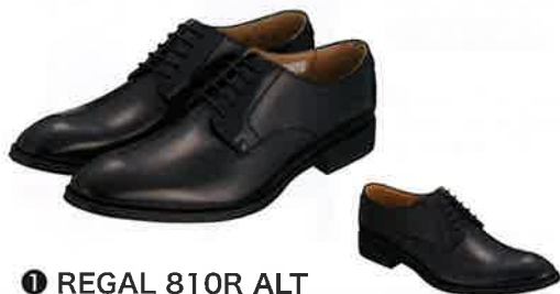
① REGAL 810R ALT プレートトゥ ブラック

シンプルなデザインで人気のビジネスシューズ オーソドックスで履き回しがしやすいプレートトゥモデル