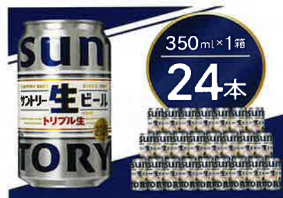
サントリー生ビール 350ml