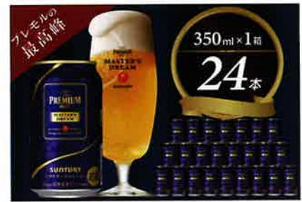
サントリー ザ・プレミアム・モルツ マスタースドリーム 350ml