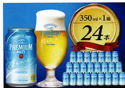
サントリー ザ・プレミアム・モルツ 〈香る〉エール 350ml