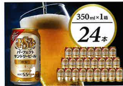
サントリー パーフェクトサントリービール 糖質ゼロ PSB 350ml