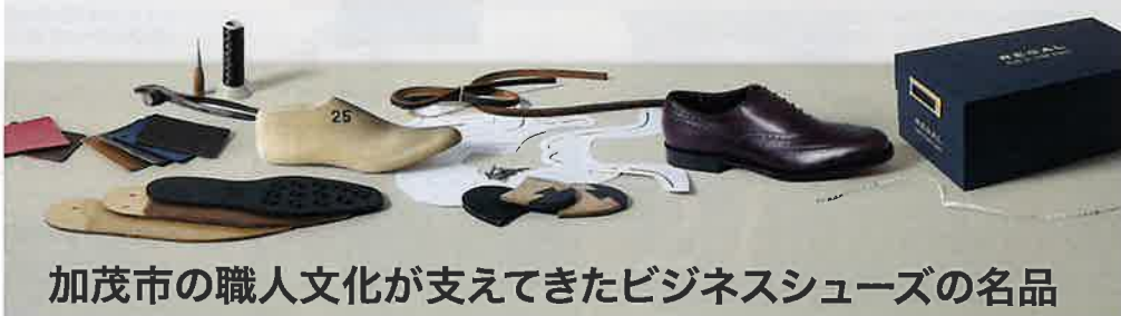
加茂市の職人文化が支えてきたビジネスシューズの名品

発祥は1880年の米国で、日本製靴(現リーガルコーポレーション)と米国ブラウン社(現クラレス社)との技術提携・ライセンス契約で1961年より紳士靴の生産を開始した「REGAL」は、60年以上も変わらない職人気質なモノづくりで時代を超える名品の数々を発表してきたブランドだ。第一線のビジネスパーソンなら一足は押さえておきたいクラシカルな定番モデルから、現代風のアレンジを施したカジュアルシューズやレディースラインまで、現在は製品ラインナップも多彩に。主力モデルの多くが加茂市内の工場で製造されており、現在でも一足一足、熟練の職人たちが自らの手で丁寧に仕立てている。