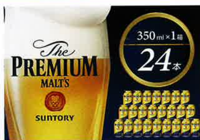
サントリー ザ・プレミアム・モルツ 350ml